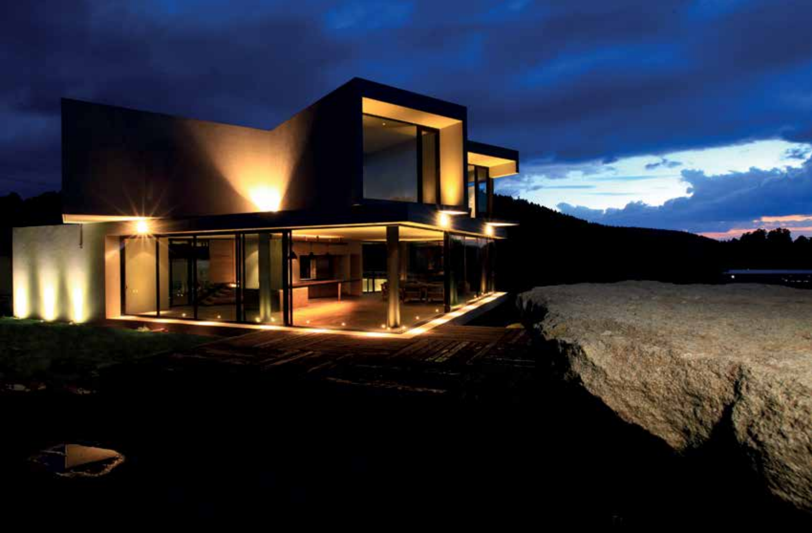
Vista nocturna de la fachada principal