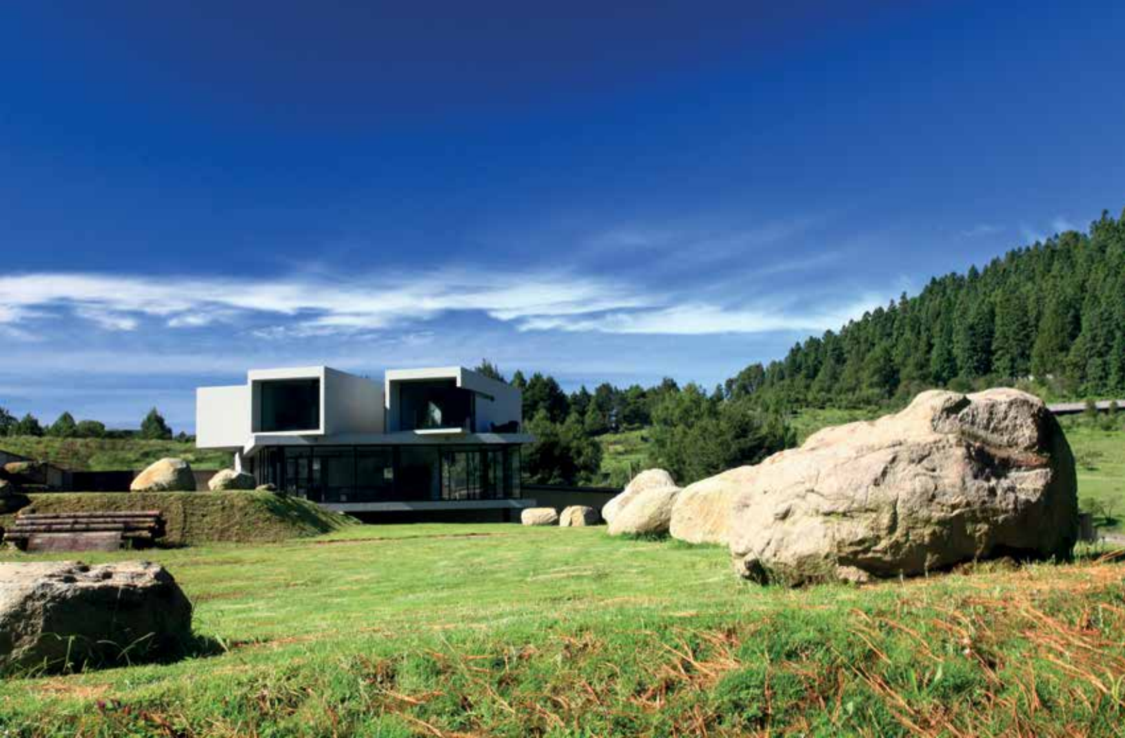
Vista de la fachada principal y la zona montañosa que rodea a la casa