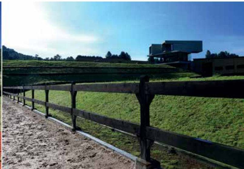
Vista desde la pista de equitación hacia la fachada Norte