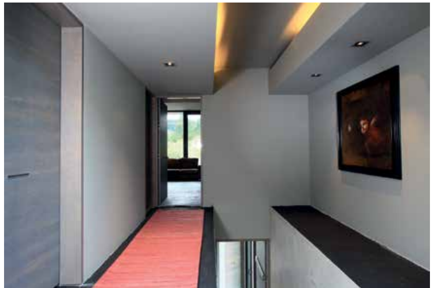
Pasillo de acceso a la recámara principal