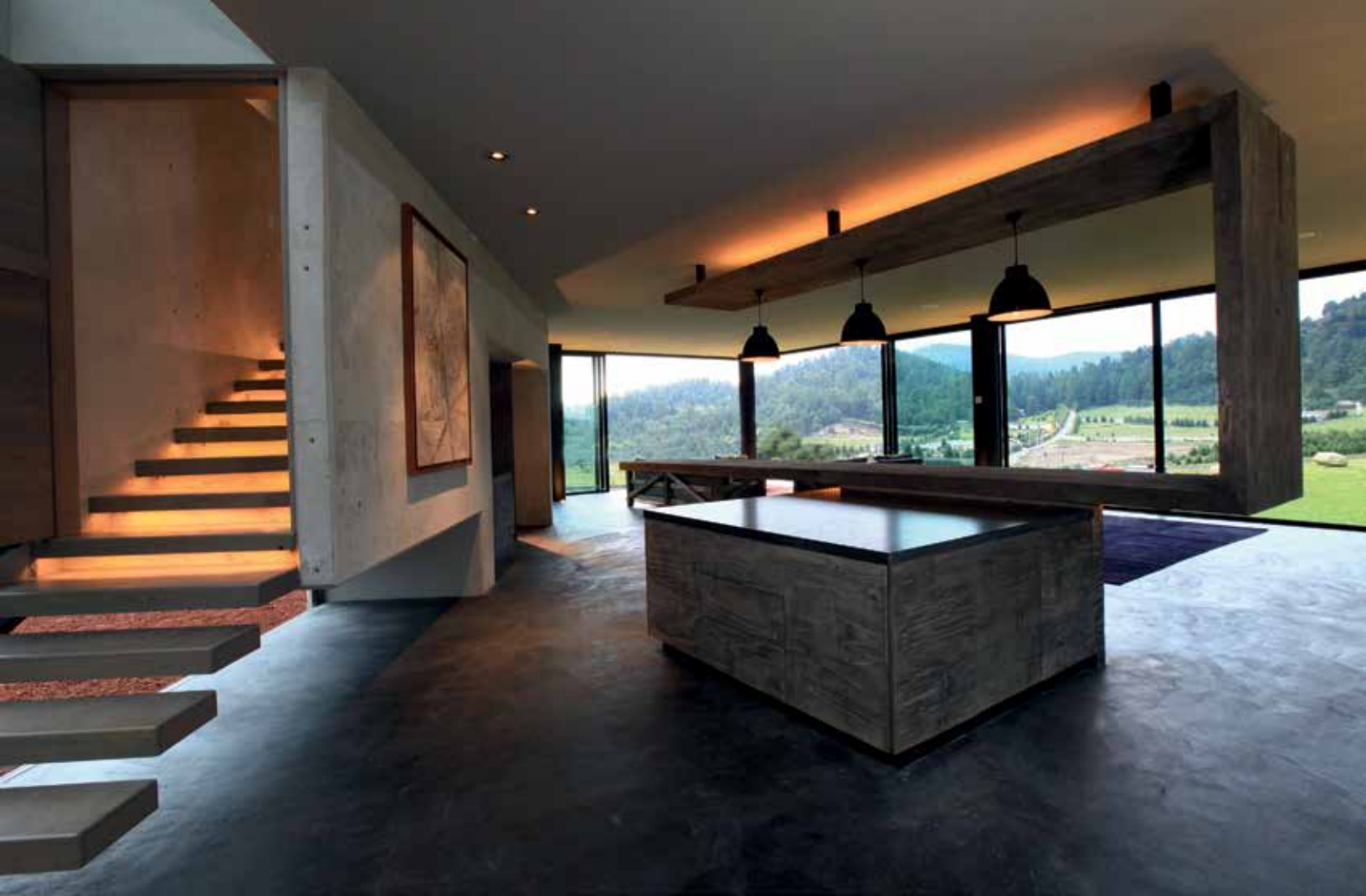
Área social de la planta baja con vistas hacia los paisajes exteriores