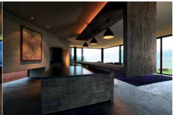
Barra de la cocina