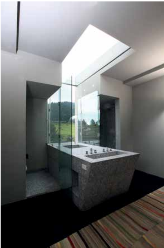
Baño de la recámara principal