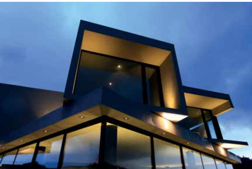
Detalle de fachada