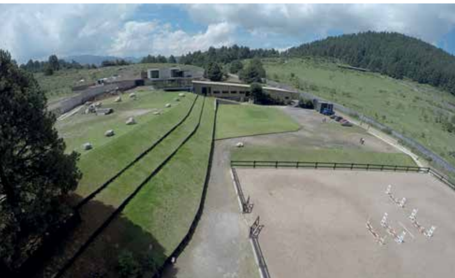
Vista aérea del rancho

El requisito más importante en este proyecto se refleja en las fachadas, era muy importante para el cliente mantener la vista montañosa y permitir el paso de luz para iluminar los espacios de forma natural; la intención era crear una casa de descanso integrándola de manera óptima con la naturaleza del sitio sin perder las comodidades primordiales que ofrece una buena distribución arquitectónica de espacios funcionales adecuados para la convivencia. Al final la casa se convierte en un elemento escultórico dentro del rancho.