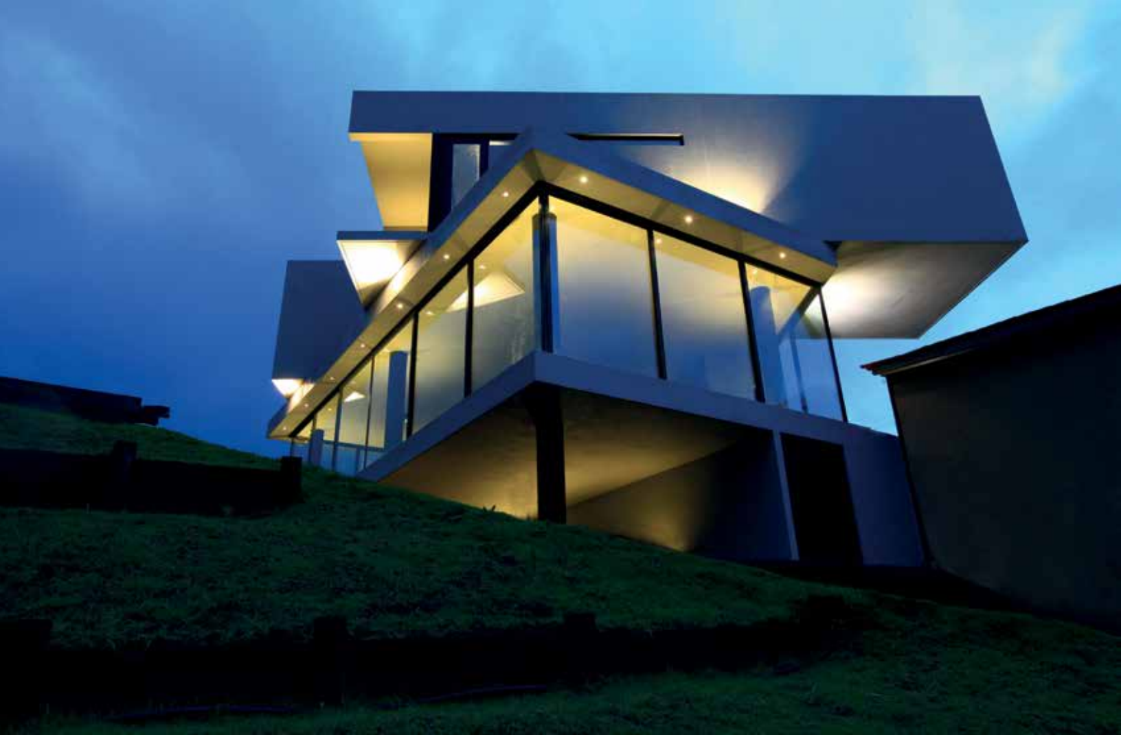
Vista nocturna de la fachada poniente