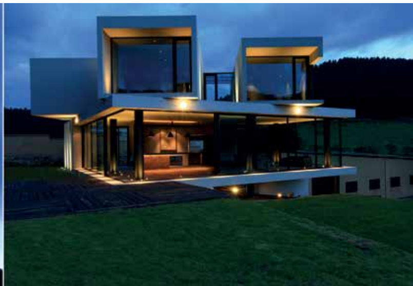
Juego de volúmenes de la fachada principal